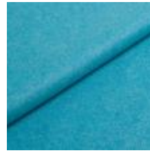
Wooly 0106 Turquoise 1039018