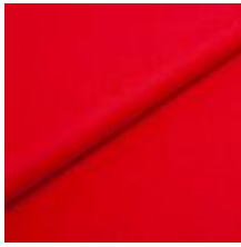
Wooly 2011 B Red 1039015