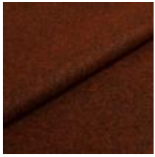
Wooly 2153 Java melange 1039014