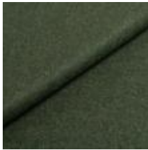
Wooly 840069 Juniper 1039028