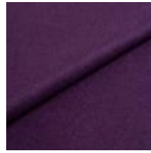
Wooly 0091 Berry 1039017