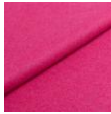
Wooly 9872 Pink 1039016