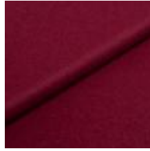
Wooly 9233 Wine 1039023