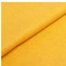
Wooly 2272 Dijon 1039009