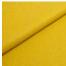
Wooly 9759 Leaf 1039003