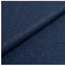
Wooly 2019 marine 1038802