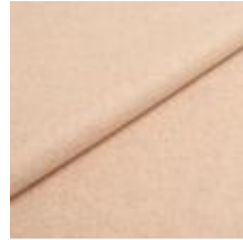
Wooly 1037 sand 1038816