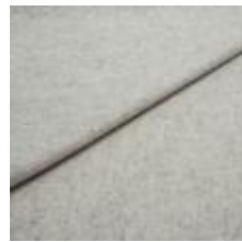
Wooly 2256 Ivory melange 1039005