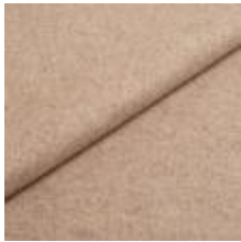
Wooly 2151 beige 1038826