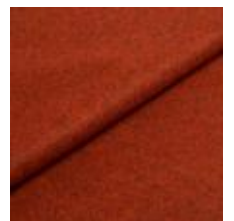
Wooly 1040 Brick melange 1039013