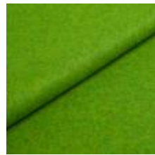
Wooly 2269 Emerald 1039004