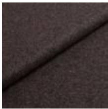
Wooly 1001 antracit 1038847