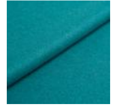
Wooly 2287 Opal 1039019