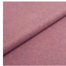
Wooly 2020 lilac melange 1038881