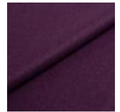
Wooly 2255 dark lilac 1038891