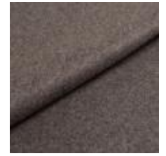
Wooly 1042 grafit 1038807