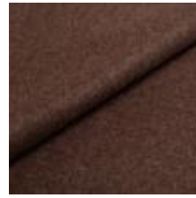
Wooly 1008 brown 1038806