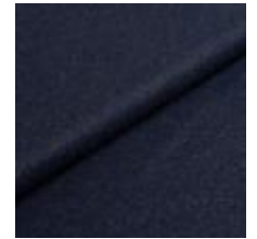
Wooly 1007 navy 1038842