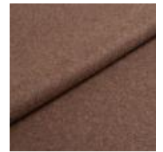
Wooly 9202 Taupe 1039007