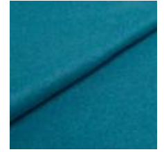
Wooly 2240 petrol 1038822