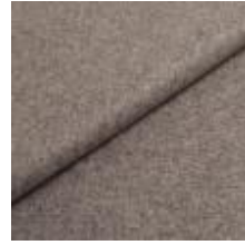
Wooly 1000 light grey 1038817